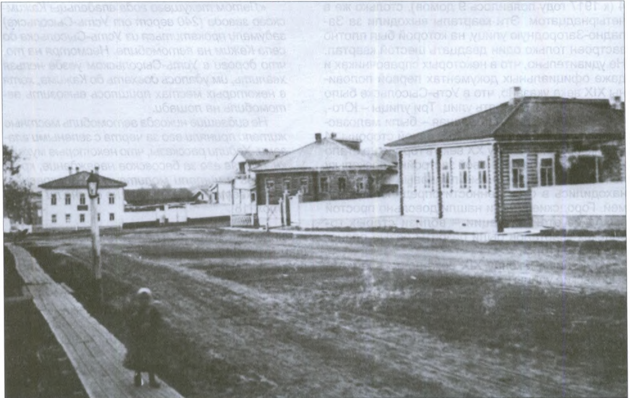
Спасская улица. На переднем плане – тротуар и фонарный столб. Начало XX века

«Воспрещается кормление у церкви лошадей; дозволить скоту, а в особенности свиньям, которые роют улицы и площади, бродить по улицам и площадям города – воспрещается, кроме случаев, когда скот прогоняется на пастбище, водопой или для убоя» (кстати говоря, запрещалось и «выпускать собак на улицу без намордников» – «для безопасности») [20].