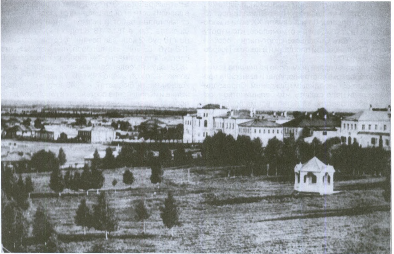
Городской сад. Начало XX века

метров. Над поверхностью земли сруб поднимался на 4-5 венцов. На нем крепилось бревно с цепью и кадушкой. Для того чтобы поднимать или опускать кадушку, перпендикулярно к бревну прикреплялось большое колесо с двумя рукоятками. В сысольских селах такой «водоподъемной» конструкции не встречалось. Выбор места и рытье колодцев требовали определенного умения, поэтому многие горожане за плату приглашали для этой цели специалистов из местных жителей. Горожане были обязаны сами очищать свои колодцы «на тот предмет, чтобы в них не было гнилости».