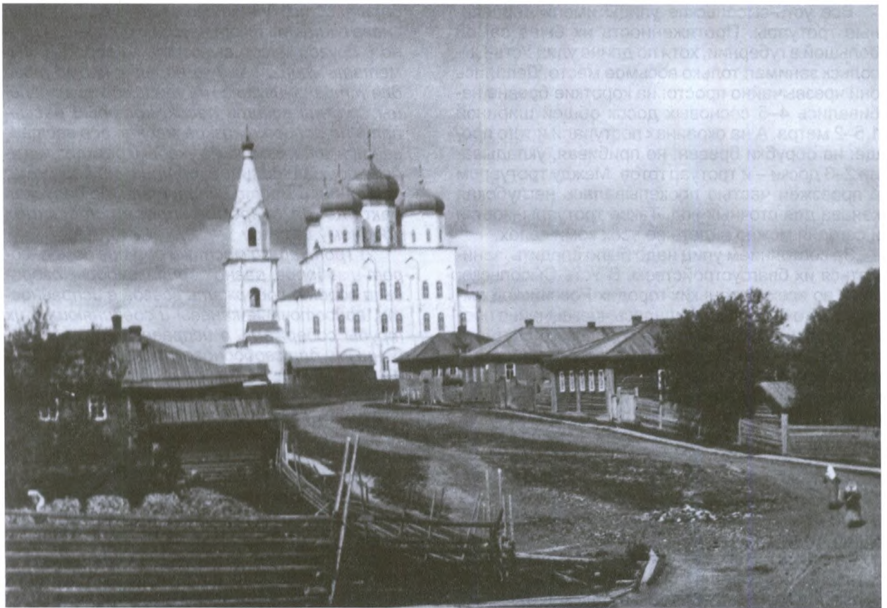
Троицкая улица и Стефановская церковь. Начало XX века