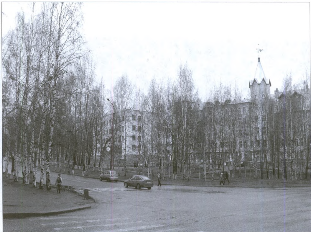
Улица Ленина в наши дни