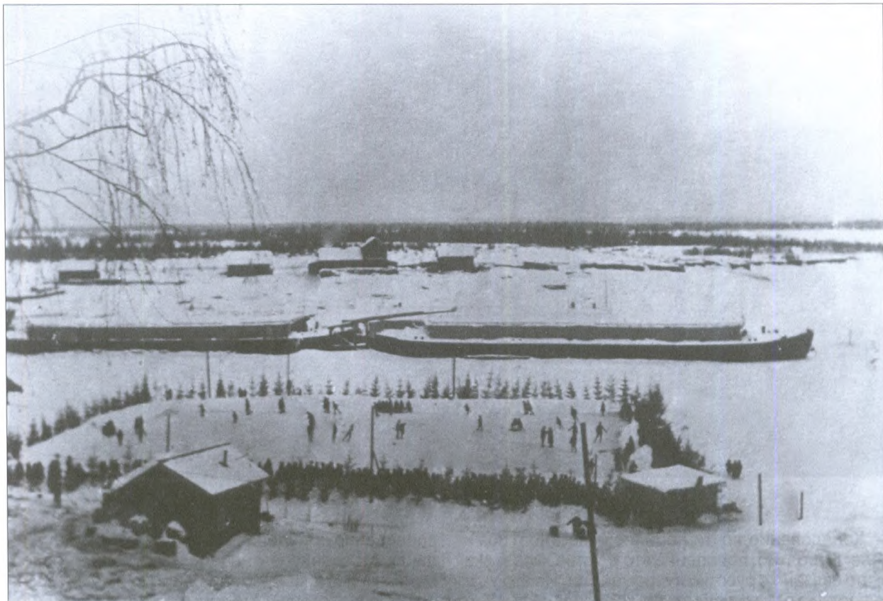
Каток на Сыsole. 1916 г.

хороводы (в конце XIX века они сохранились только на окраине), пела. Пасхальные увеселения продолжались целую неделю.