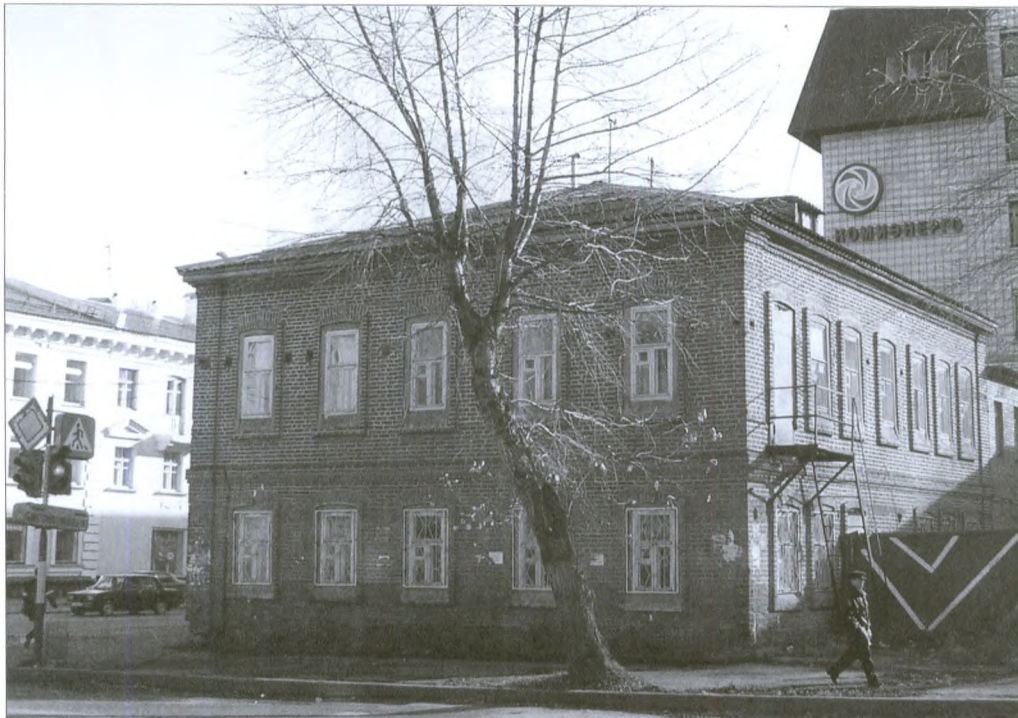
Дом Жеребцова. Современный снимок