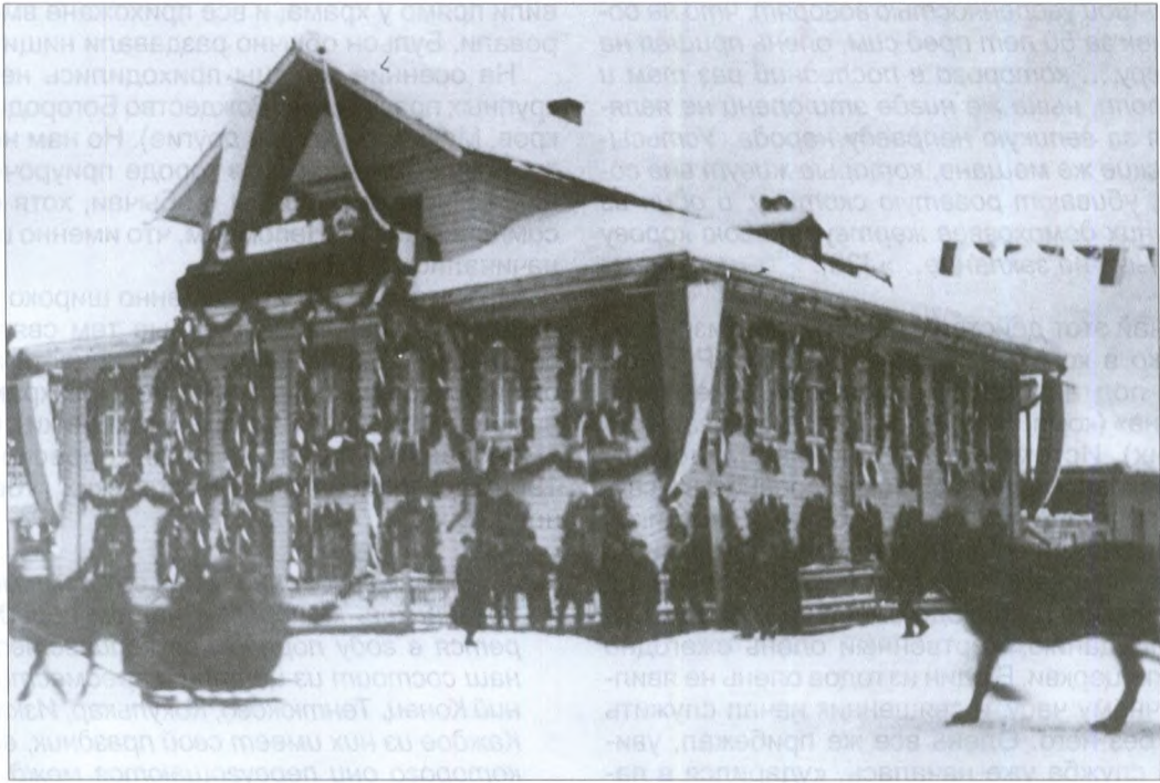
Земская управа, украшенная к празднованию 300-летия Дома Романовых. 1913 г.

визиты. Полагалось наносить визиты не только друзьям, хорошим знакомым, но и сослуживцам, и в первую очередь начальству. В этом случае чаще всего ограничивались оставлением визитной карточки. Для избранного круга хозяева готовили стол с «легкими» закусками. Во время визита гости надолго не задерживались. Приглашать гостей в дом на праздники не было принято. Но представители интеллигенции нередко собирались в клубе. Впрочем, совместными праздничными вечерами с танцами отмечались только Рождество и Новый год.