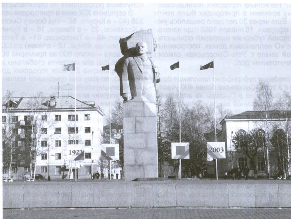
Стефановская площадь в наши дни