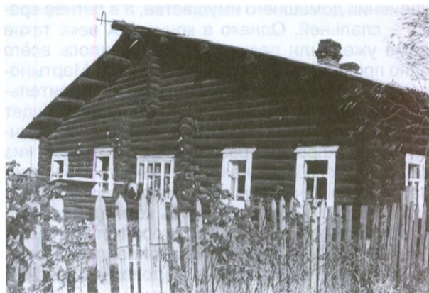
Дом с жилой горницей вместо сеней. Современный снимок