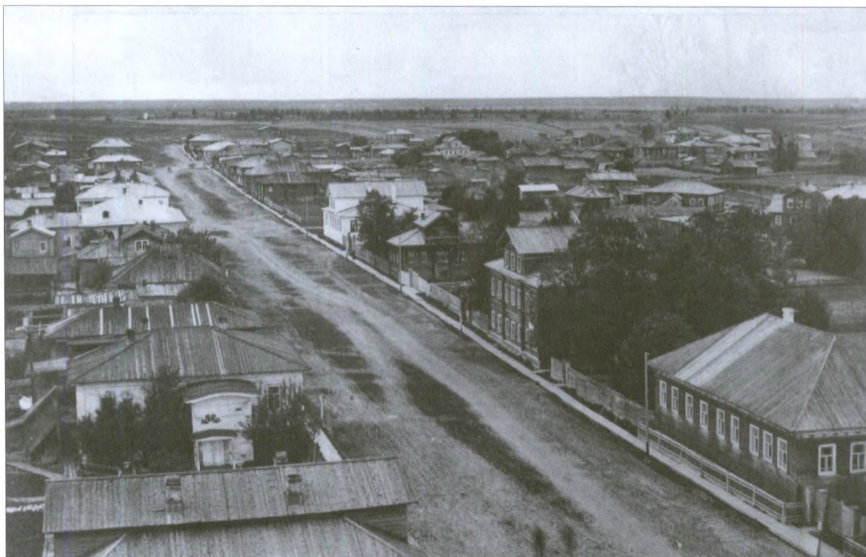
Покровская улица. Начало XX века