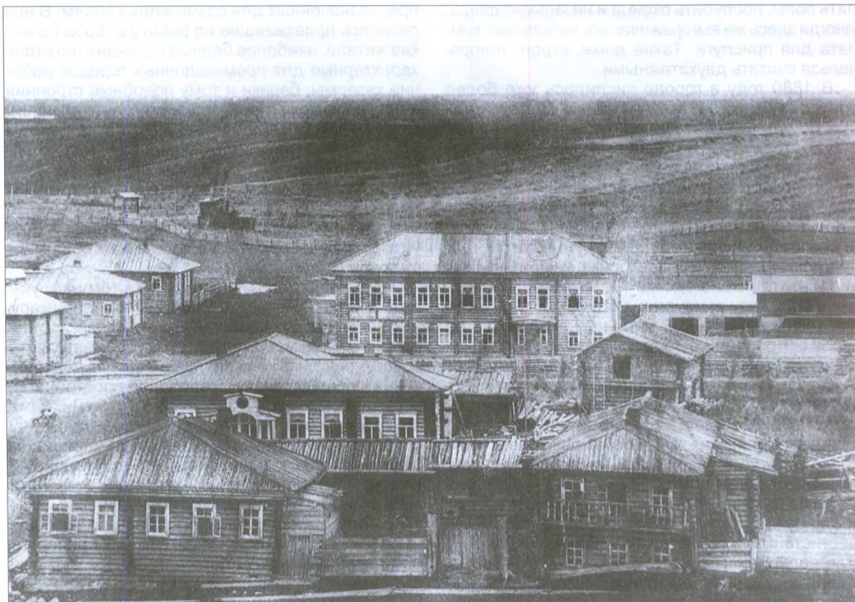
Трехсвятительская улица. На заднем плане – один из “доходных домов”. Начало XX века

родского центра пятистенков начал «триумфальное наступление» сперва на городские окраины, а затем и в коми село, где к концу XIX века он стал одним из самых распространенных типов домов.