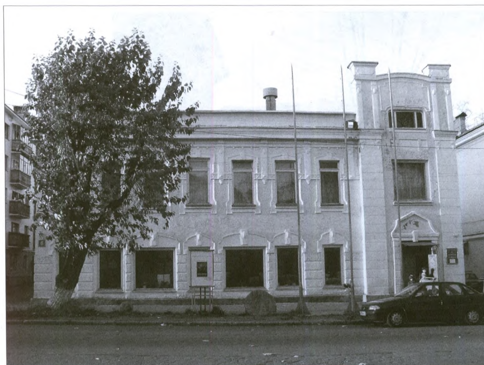
Национальный музей РК (бывший дом Кузьбожевых)

Однако запрещение на строительство двухэтажных домов довольно быстро было отменено. В июле 1844 года вологодский губернатор обратился в Министерство внутренних дел с просьбой