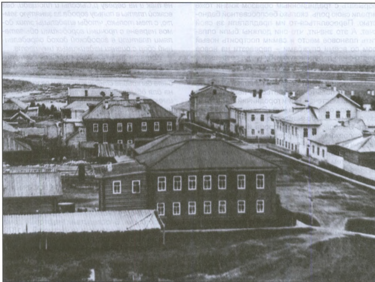
Стефановская площадь и Трехсвятительская улица. Вид с колокольни Стефановской церкви. Начало XX века