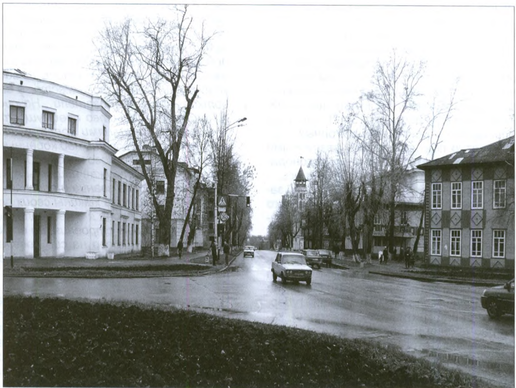
Улица Советская в наши дни