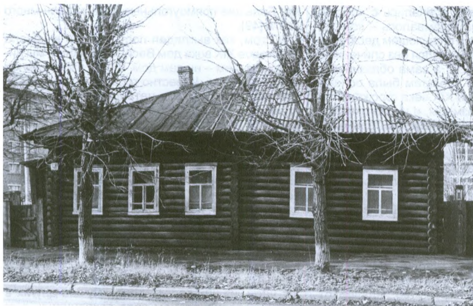
Городской дом-крестовик. Современный снимок

разрешить строить двухэтажные дома и в городах Вологодской губернии. Он ссылался на донесение городничего Тотьмы, который отмечал, что после пожара, случившегося в 1843 году, многие горожане хотели бы построить именно такие дома. Интересно, что губернатор считал, что двухэтажные дома выгодны прежде всего бедным горожанам – и материала на строительство уходит меньше, и один этаж можно сдавать. Вопрос был решен на удивление быстро – уже в сентябре 1844 года губернатор был извещен о том, что «Государь Император Высочайше повелеть соизволил» разрешить строительство таких домов, что и было закреплено Высочайшим указом «О разрешении жителям