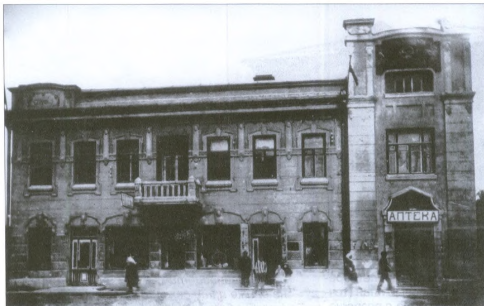
Дом Кузьбожевых. Снимок 40-х гг. XX в.

ми только цветами: белым, палевым, бледно-желтым, светло-серым, диким, бледно-розовым, сибиркою, но с большею примесью белой краски и желто-серым». А чтобы горожане не сомневались, является ли выбранный ими цвет «диким» или «сибиркою», в города были доставлены дощечки «для показания настоящих цветов» [45]. Так что государь лично заботился об эстетическом воспитании подданных!