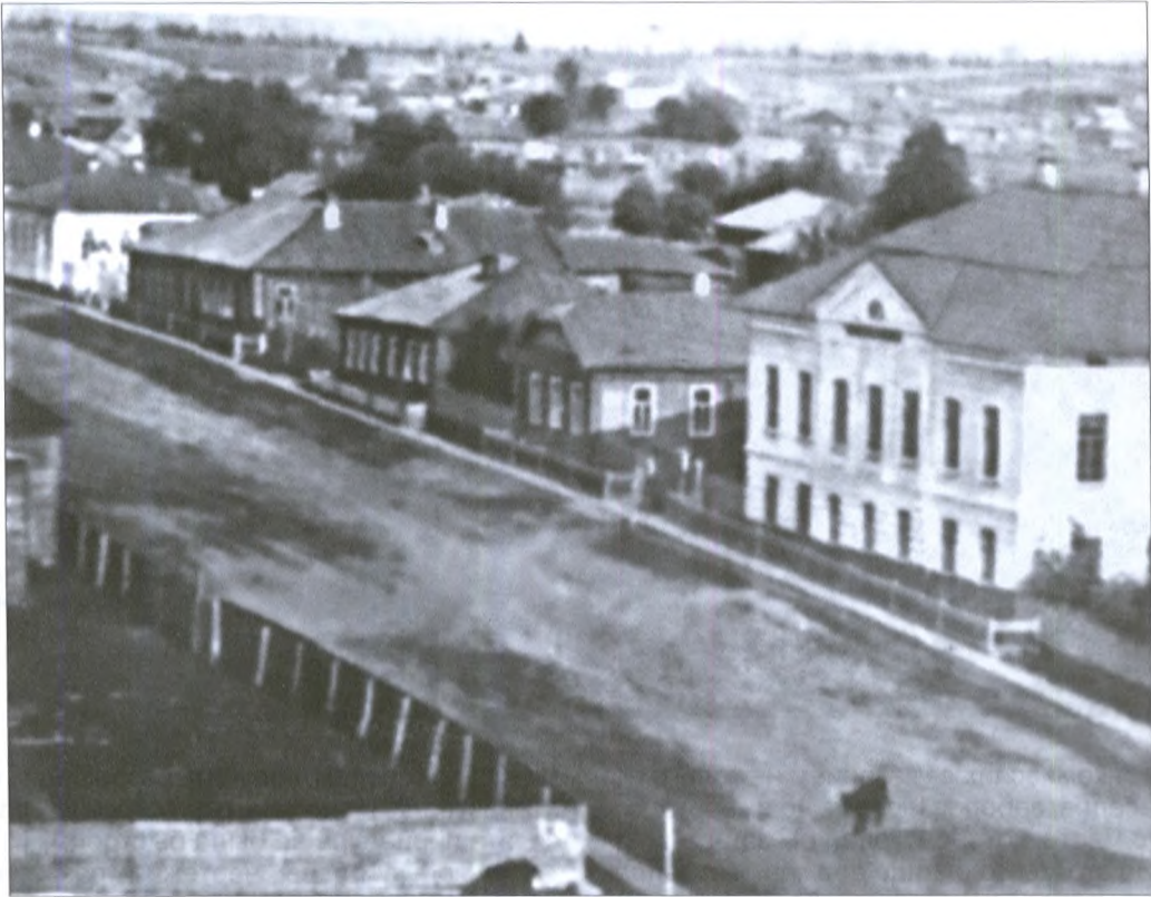
Покровская улица. На переднем плане – дом Суханова

«Партикулярные каменные дома могут строить против прочих вновь строящихся городов по представленным при сем примерным фасадам под № 1, 2 и 3 какие в каком г[осподин] ген[ерал]-гу[бернатор]... назначит, и купеческие с лавками дома по фасаду под № 6. По желанию хозяев позволить строить и выше сих фасадов и с лучшими украшениями, [от пожара] делать брандмауэры от кровли не ниже аршина, а стоков с кровель на соседние дворы не делать. Деревянные дома... строить по фасадам № 3, 4 и 5 на каменных жилых погребах, на каменных фундаментах и без каменных фундаментов, кто как пожелает, но чтоб всякое деревянное одно от другого не ближе 5 сажень, не выше 6 аршин*, а не более каждый деревянный корпус строить двенадцати сажень, а в два жила деревянное строить не допускать... Кровь крыть на каменных железом или черепицею, а доколе черепичные заводы размножатся тесом и гонтом, на деревянные строения тесом и гонтом...» [42].