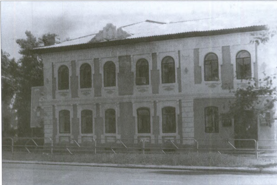
Дом Оплеснина. Современный снимок

домов мест комиссии» с указанием не только номеров фасадов, заборов и ворот, но и квартала и планового места, которое желал бы занять застройщик. За это место он еще должен был заплатить в городскую казну (поэтому бедные горожане просили разрешить им строиться на выгонной земле – за нее не надо было платить). Документы рассматривались губернским землемером, после чего возвращались в городскую думу. Только тогда счастливый потенциальный новосел получал утвержденные план участка, чертежи фасада, забора, ворот и разрешение на строительство, подписанное городничим, губернским землемером, гласными городской думы и ратмана-