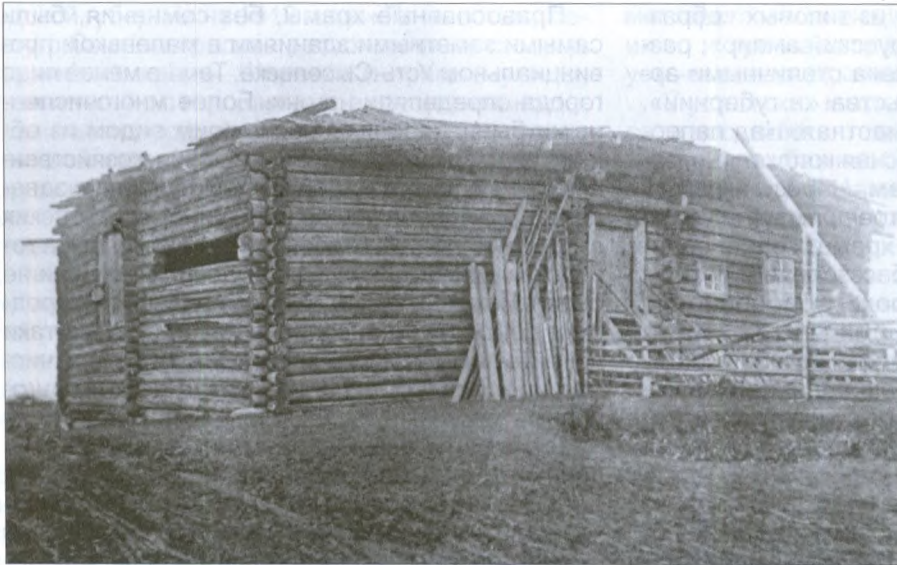
Курная изба в пригородном местечке

лавки-подвала и всего 3 жилых (к прежним прибавился дом с флигелем купчихи Людмилы Суворовой на набережной улице, построенный в 1877/78 годах на месте разобранной ратуши).