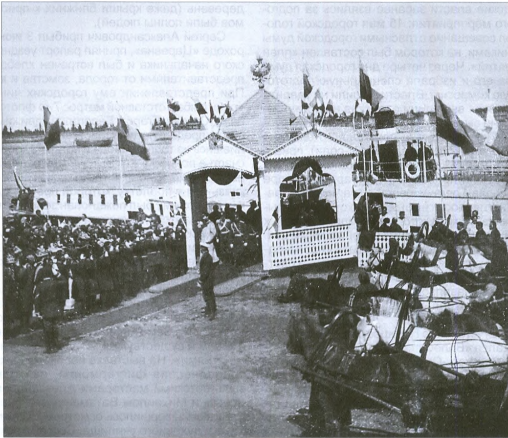
Встреча великого князя Сергея Александровича на пристани. 3 июля 1898 г.

Горожане еще долго вспоминали кратковременный визит великого князя. На память о нем остался павильон-беседка, правда, перенесенный с пристани в городской сад. А городская дума вместе с земской управой все никак не могли разобраться, куда ушли средства, выделенные на встречу высокого гостя.