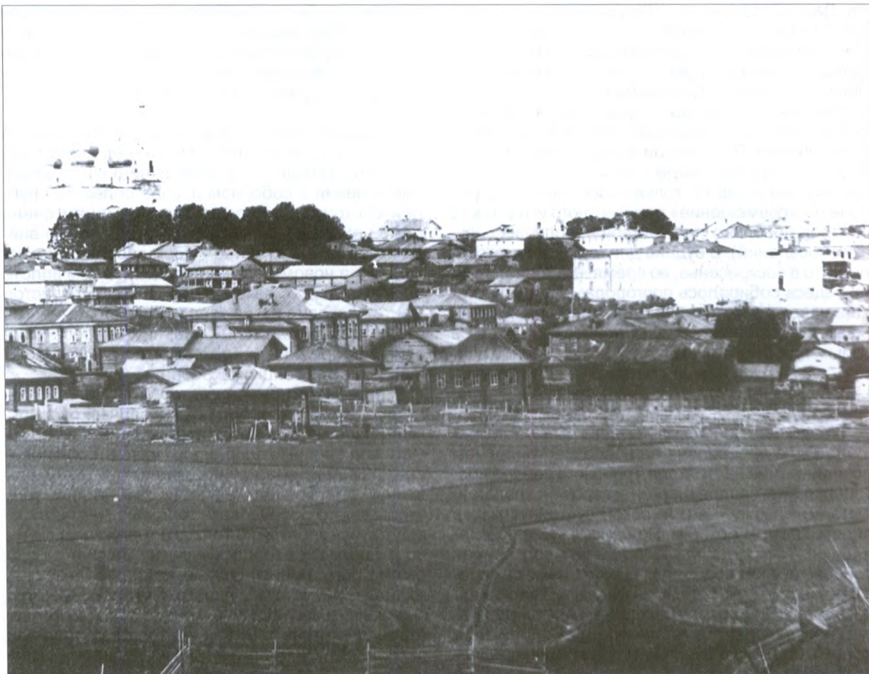
Городская окраина со стороны местечка Кируль

хождение. В комментариях к плану регулярной застройки 1783 года было отмечено: «У которых обывателей нынешние строения не придут в линию, оставить до такого времени, когда сами собою обветшают, повалятся и другим каким случаем уничтожатся, или хозяева сами добровольно прежде того перестроить по плану пожелают». Исключение составляли дома, «разделяющие улицы» (оказавшиеся на проезжей части), — их надлежало немедленно разобрать и перенести на выделенные плановые места. Устьсысольцы дома свои строили добротнo, и городским властям очень долго пришлось ждать, пока они «обветшают и повалятся». В «Оценочном реестре недвижимых имуществ» за 1855 год отмечено около десятка домов, «стоящих в глубине квартала без планового места» [12]. Возможно, это последние из домов сельского Усть-Сысольска.