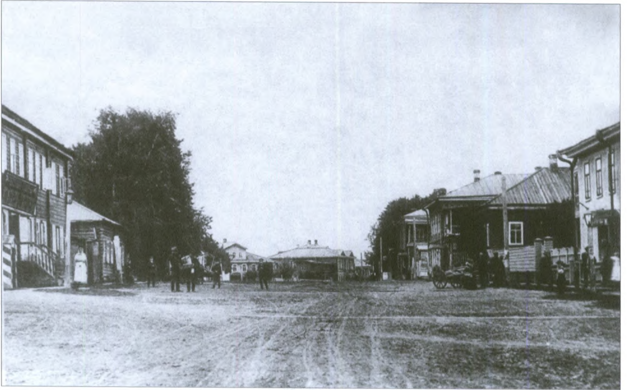
Спасская улица. Начало XX века