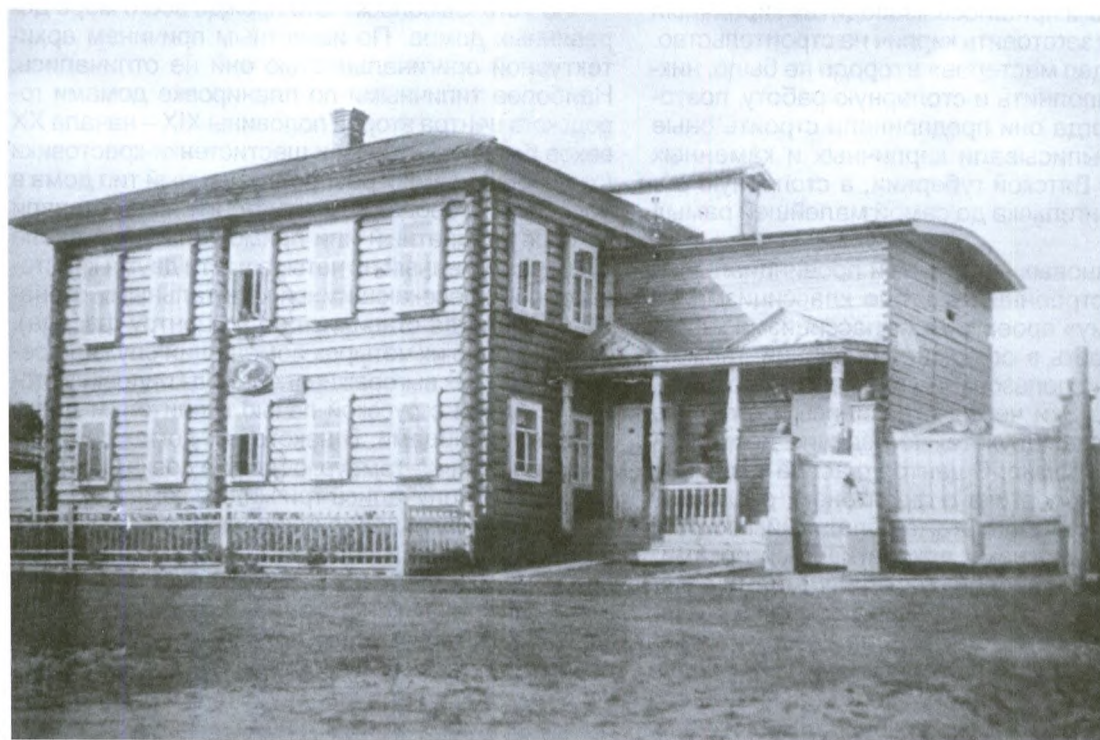
Двух- этажный дом-крес- товик Забое- вых. Начало XX века

Постепенно и государственный контроль за частным строительством начал ослабевать. Надо иметь в виду, что он и раньше все же не был абсолютным. Застройщики обязывались придерживаться типовых фасадов лишь в общих чертах и имели право несколько изменять их в соответствии со своими вкусами и возможностями. Внутренняя планировка жилища вообще была их личным делом, но, конечно, она должна была быть «привязана» к выбранному «образцовому фасаду». В 50-е годы XIX века мещане в прошении стали указывать только размеры жилого строения и число окон по фасаду. Еще в 70-е годы представ-