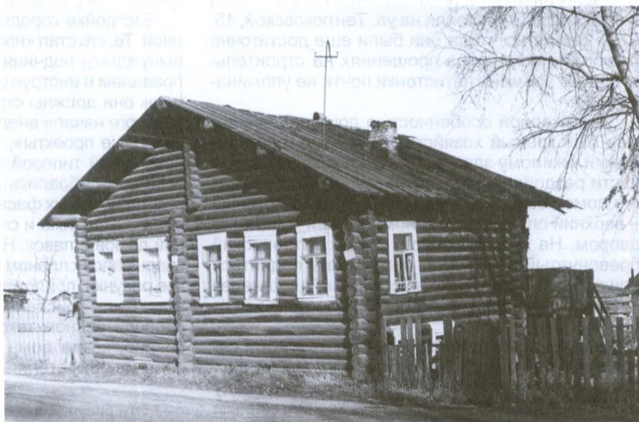
Дом-пятистенок. Современный снимок

Первоначально в таком доме жилой была только одна изба, а вторая (клеть) служила для