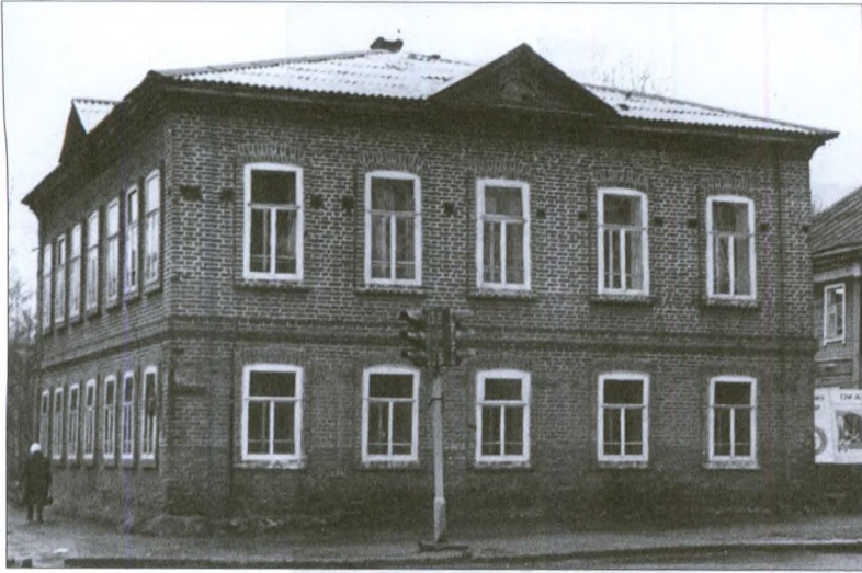
Дом Жеребцова. Современный снимок

пить ей это право. Просьба была удовлетворена, и почтенная дама получила новый план (точнее, копию старого), а план Латкина с разрешением на строительство был сдан в комиссию, посему и сохранился (это как раз самый распространенный вариант – фасад 3-й части под № 9, ворота № 82 и забор № 55). Вот это разрешение (обратите внимание – в разрешении указывалась и обязанность хозяина содержать в порядке участок улицы перед своим домом):